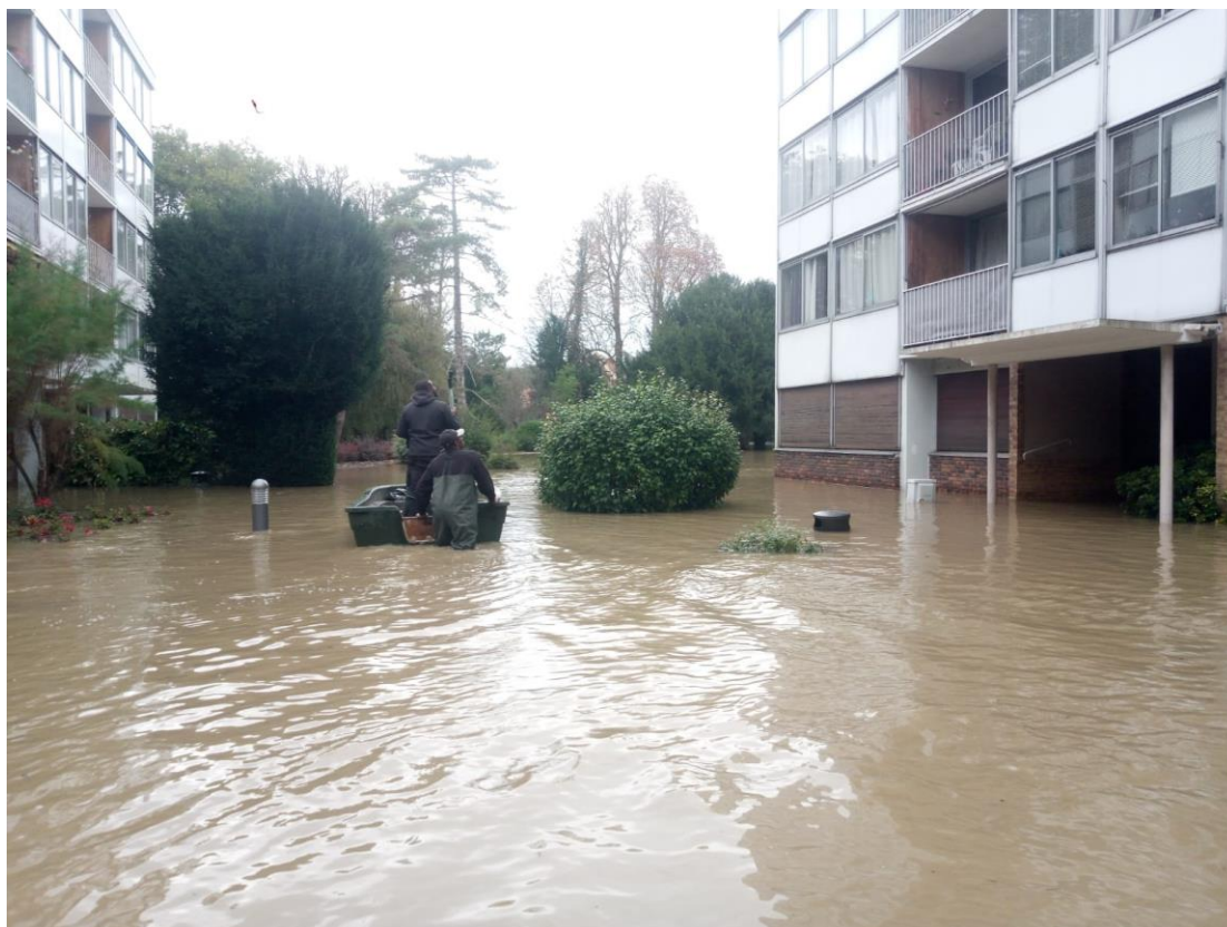
Figure 1 : Crue d'octobre 2024 à Boussy-Saint-Antoine

inondable et la reconquête des milieux humides pouvant participer à l'écroulement des crues et ainsi réduire les conséquences des inondations.