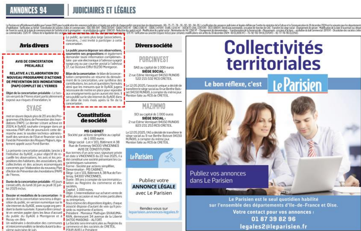
Figure 5 : Exemple de coupure de presse mentionnant l'avis de concertation préalable relative au PAPI