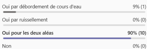
Figure 6 : Exemple de question posée lors du sondage